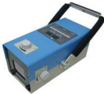
AJEX 9020H (Max 90kV/Max 20 mA)